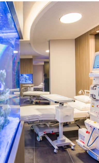
BLICK IN DIE DIALYSESTATION

Auch im vergangenen Jahr engagierte sich die Privatklinik Lindberg in sozialen Projekten. So konnten im Oktober 2019 anlässlich des zum zweiten Mal durchgeführten Dinners in Rosa ein stolzer Betrag von CHF 17 400.- der Krebsliga Zürich überreicht werden.